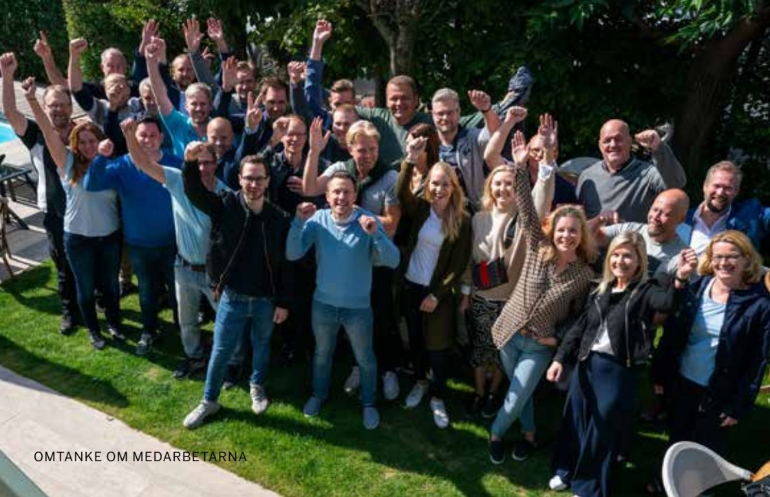
OMTANKE OM MEDARBETARNA